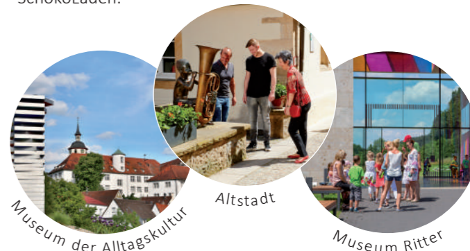
Museum der Alltagskultur

Während der historische Altstadtkern mit seinen Fachwerkhäusern, Brunnen und Staffeln einem Freilichtmuseum gleicht, sorgen das wunderschöne Schloss und der 36 Meter hohe Kirchturm der Stadtkirche St. Veit für Begeisterung. Neben schwäbischer Gastfreundschaft, Charme und Lebensqualität bietet die Stadt mit Schokoladenseiten attraktive Freizeit- und Erholungsangebote. Dazu gehören unter anderem das Museum der Alltagskultur, das Museum Ritter sowie der RITTER SPORT SchokoLaden.